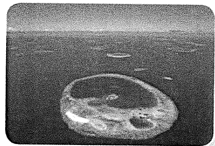
Het Groot Barrièrerif.

Oceanië is een werelddeel dat bestaat uit duizenden eilanden. Veel eilanden zijn eigenlijk de toppen van oude vulkanen die boven water liggen. Veruit het grootste eiland is Australië. Het binnenland van Australië noem je outback. Het bestaat vooral uit woestijn en bush: bossen. Langs de kust van Australië ligt het grootste koraalrif ter wereld: het Groot Barrièrerif. Het is gemaakt door koraaldiertjes. Voordat de Europeanen naar Oceanië kwamen, woonden er al eeuwenlang mensen als jager-verzamelaar. De oorspronkelijke bewoners van Australië zijn de Aboriginals. In Nieuw-Zeeland waren de Maori's de baas. Op het eiland Nieuw-Guinea wonen de Papoea's. Zij leven nog steeds zoals in de steentijd.