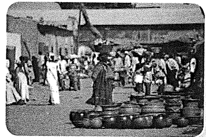
Veel producten worden op de markt gekocht.

De grenzen van veel landen in Afrika zijn bepaald door de Europeanen die er vroeger de baas waren. Een land dat door een ander land bestuurd wordt, noem je een kolonie. Na de Tweede Wereldoorlog wilden de landen zelf de baas zijn. Toen begon de periode van dekolonisatie. Dat zorgde voor nieuwe problemen. In onze tijd zijn veel landen nog steeds ontwikkelingslanden. Zij krijgen geld en hulp van rijke landen.