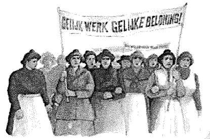
Vrouwen eisen gelijke rechten.

Enkele Europese landen verdienen veel geld aan de slavenhandel. Er komt steeds meer verzet. In de Verenigde Staten leidt de afschaffing van de slavernij tot een burgeroorlog.