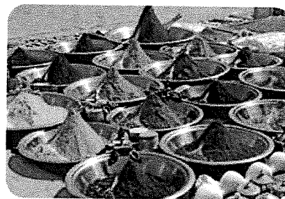
Met pigmenten en wat olie kun je verf maken.

Van sommige kleuren word je vrolijk, van andere somber of rustig. Dat heet kleurbeleving. Om anderen te laten zien dat we bij een groep horen, gebruiken we groepskleur. Met kleuren en vormen kun je mensen voor de gek houden. Als een tekening lijkt te bewegen terwijl hij stilstaat, is dat gezichtsbedrog. Ook in straattekeningen gebruiken kunstenaars gezichtsbedrog. Razzle dazzle is gezichtsbedrog dat je gebruikt om juist niet op te vallen, zoals een zebra in een kudde.