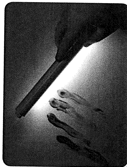
Met ultraviolet licht kun je sporen zichtbaar maken.

Er zijn twee kleuren die wij mensen niet kunnen zien: infrarood en ultraviolet. Sommige dieren kunnen die kleuren wel zien. Infrarood is de kleur die warme voorwerpen uitstralen. Met ultraviolet licht kun je sporen zichtbaar maken of dwars door een verflaag kijken.