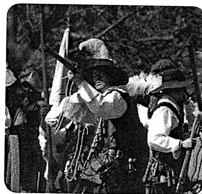
Nederlanders vechten tegen Spanje.

Er wordt gevochten in de Nederlanden. De Unie van Utrecht legt vast dat de Nederlanden samen vechten tegen de Spaanse vijand. Het Plakkaat van Verlatinghe legt vast dat Filips niet meer hun heer is. De Spanjaarden vechten natuurlijk terug. Zij veroveren Antwerpen. Met de Val van Antwerpen worden de Nederlanden in tweeën gedeeld. Het zuiden wordt weer katholiek. En het noorden protestant. In het noorden krijgt het volk de macht. Ze noemen zichzelf de Republiek der Zeven Verenigde Nederlanden.