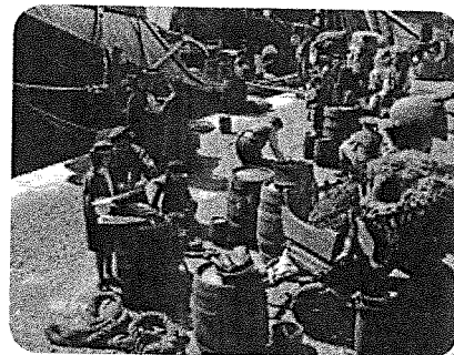
Het is druk in de haven.

Nadat Columbus Amerika heeft ontdekt gaan ontdekkingsreizigers ook naar het westen. Ze halen daar goud en zilver. De schepen samen heten de zilvervloot. In Antwerpen komen producten uit de hele wereld aan in de haven. Daar worden ze opgeslagen en verkocht. Antwerpen is een stapelmarkt.