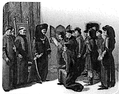
De heerlijkheden beloven trouw aan de hertog.

De hertogen zijn rijk en dat laten ze graag zien. Ze laten schilderijen maken, bijvoorbeeld door Jeroen Bosch. Rijke poorters mogen niet dezelfde kleding dragen als de hertog. Ze moeten zich aan de kledingvoorschriften houden.