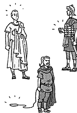
Verdeel en heers.

In 395 wordt het Romeinse Rijk in tweeën gedeeld. Steeds vaker worden de rijken aangevallen door andere volkeren. Bijvoorbeeld door de Hunnen. Veel volkeren slaan op de vlucht. Zo ontstaat een grote volksverhuizing. De Hunnen en andere volkeren vallen het Romeinse Rijk binnen. En ze winnen. Dit betekent de val van het West-Romeinse Rijk.