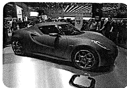
In Noord-Italië worden veel auto's gemaakt.

In het noorden van Italië zijn veel autofabrieken. Het in elkaar zetten van auto's noem je assemblage. Daarom noem je de auto-industrie een assemblage-industrie.