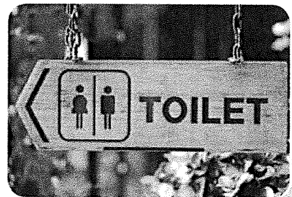
Toiletten zijn voorzieningen.

Mensen die een dagje op pad gaan, noem je recreanten. Mensen die op vakantie zijn en een nacht ergens slapen, noem je toeristen. Een park heeft voorzieningen voor recreanten. Bijvoorbeeld toiletten of een restaurant.