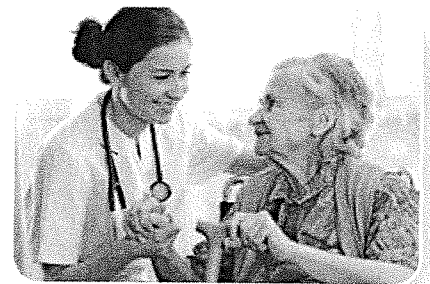
De verpleegster verzorgt mensen.

Veel mensen werken in de recreatie op plekken waar jij je kunt vermaken, bijvoorbeeld in zwembaden.