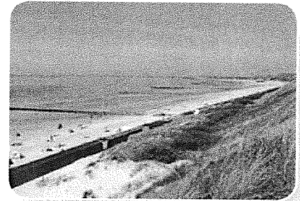
Duinen beschermen Nederland tegen het water van de Noordzee.

Als er veel neerslag valt, staat het water in de rivieren hoog. Daarom bouwen we ook langs de rivieren dijken.