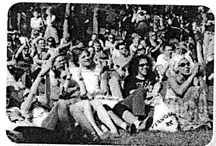
Jongeren luisteren naar popmuziek.

Het gaat goed in Nederland, er is steeds meer werk. Maar we hebben niet genoeg mensen om dat werk te doen. Daarom vragen we gastarbeiders uit Italië of Spanje om bij ons te komen werken. Later komen ook hun vrouwen en kinderen naar Nederland. Dat noem je gezinshereniging. Jongeren gaan steeds meer nadenken over hun leven en de wereld. Ze demonstreren tegen geweld of voor meer loon. Ze gaan zich anders kleden dan hun ouders. En ze luisteren graag naar popmuziek. Ouderen wonen eerst nog bij hun kinderen als ze niet meer werken. Maar minister Willem Drees geeft hun een pensioen. Nu kunnen ze op zichzelf blijven wonen. Als ze toch hulp nodig hebben, gaan ze in een bejaardentehuis wonen.