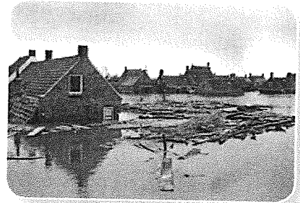
De watersnoodramp in Zeeland.

De oorlog is voorbij, maar veel steden liggen in puin. Gebouwen en huizen zijn kapot. Er is woningnood. Niet iedereen kan in een eigen huis wonen. Daarom worden er noodwoningen gebouwd. Daarin kun je een tijdje wonen, totdat je echte huis klaar is. Het bouwen van huizen en gebouwen en het aanleggen van nieuwe wegen noem je de wederopbouw. Veel mensen willen niet meer in Nederland wonen en gaan emigreren. Bijvoorbeeld naar Canada of Australië. Kort na de oorlog maakt Nederland een nieuwe ramp mee: de watersnood. Grote delen van Zeeland, Noord-Brabant en Zuid-Holland overstroomden. Om ervoor te zorgen dat zo'n ramp niet weer kan gebeuren, maken we sterke dammen en dijken: de Deltawerken.