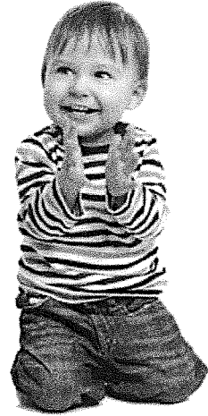
Peuters leren veel nieuwe dingen.

Een kind dat ouder is dan 1 jaar en jonger dan 4 noem je een peuter. Peuters leren heel veel nieuwe dingen, zoals praten, lopen en zelf eten. Als de peuter 4 jaar wordt, noem je hem een kleuter. Veel jonge zoogdieren zijn net kleuters. Ze zijn heel nieuwsgierig en oefenen dingen die ze later misschien in het echt moeten doen. Tussen je tiende en je achttiende verandert je lichaam. Ook in je hoofd verandert er veel. Je wilt zelf beslissen wat je gaat doen. Deze periode heet de puberteit. Vanaf je achttiende ben je volwassen.