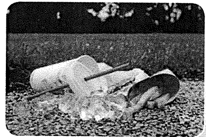
Wanneer je afval op straat gooit, vervuult je het milieu.

Veel apparaten werken op stroom. Stroom noem je ook wel elektriciteit. Met batterijen of door de stekker in het stopcontact te steken krijgen de apparaten energie. Dat wordt gemaakt in een elektriciteitscentrale. In de centrale wordt vuur gemaakt met gas, olie of kolen. Dat zijn energiebronnen. Het afval van deze energiebronnen is slecht voor het milieu. Ze zorgen voor milieuvervuiling. Daarom zoeken we naar schone energiebronnen, zoals de wind en de zon.