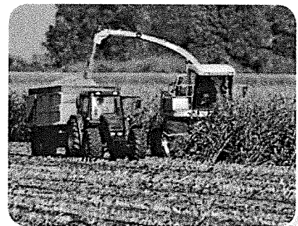
Akkerbouw: maïs oogsten.

Wil je weten waar een stad of een rivier ligt? Dan kijk je in een atlas. Dat is een boek met heel veel kaarten. Je zoekt de naam van de stad of de rivier op in het register. Daar staat op welke kaart en in welk kaartvak je moet kijken.