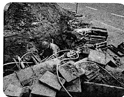
Er gaat een nieuwe kabel naar jouw huis.

Elektriciteit is een ander woord voor stroom. Via een kabel of leiding komt het je huis binnen. Net als gas en water. Water wordt bijvoorbeeld gebruikt voor de centrale verwarming en de wc. Al dat water moet ook het huis weer uit. Dat gaat via de riolering. Gas gebruik je om te koken. Hoeveel gas je precies gebruikt, staat op de gasmeter. Op de plattegrond van je huis kun je zien waar de leidingen voor gas, water en elektriciteit lopen. In de legenda bij de plattegrond staan symbolen. Zo weet je welke leiding voor gas is en welke voor water of elektriciteit. Ook bij de plattegrond van de wijk staan symbolen. Bijvoorbeeld voor een rotonde.