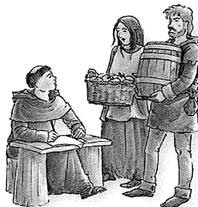
Horigen geven een tiende van hun oogst aan de heer.

De horigen krijgen van de heer ook een stukje land voor zichzelf. Dat mogen ze bewerken. Maar ze moeten de heer wel een tiende van hun oogst geven. Van al zijn horigen krijgt de heer een tiende. Alles wat hij krijgt, bergt hij op in een tiendschuur.