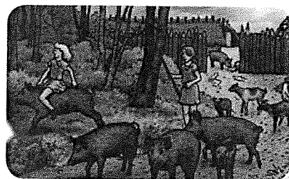
Boeren wonen in een dorp.