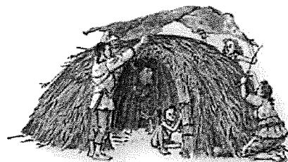
Jagers bouwen een hut.